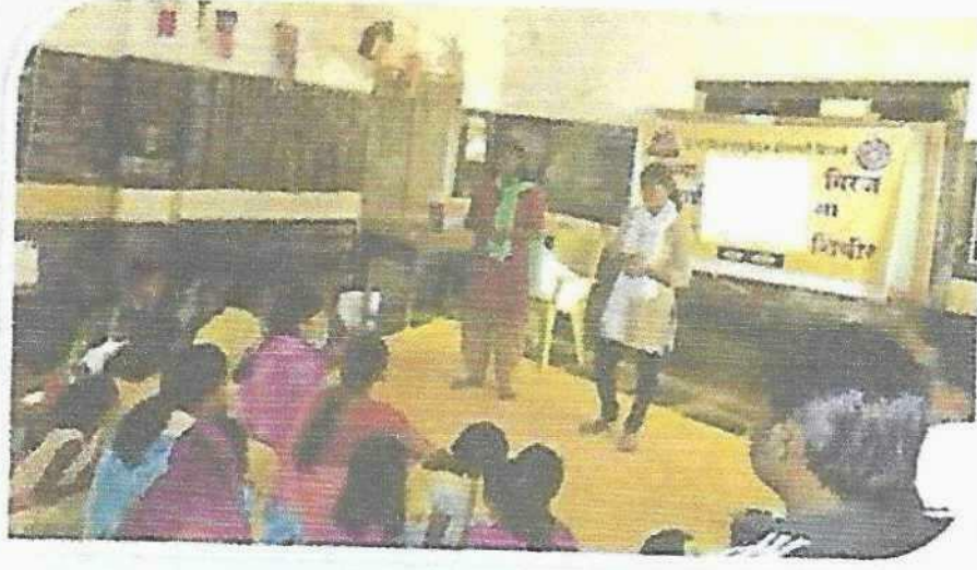
गावातील महिलांना विविध विषयांवर प्रबोधन करताना स्वयंसेविका