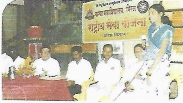
उद्घाटन समारंभात मनोगत व्यक्त करताना नूतन सरपंच